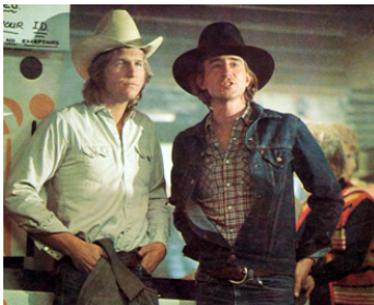
1975 RANCHO DELUXE (Rancho Deluxe) de Frank Perry avec Jeff Bridges