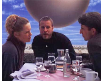
1990 MINDWALK (Mindwalk) de Bernd Amadeus Capra avec Liv Ullmann, John Heard