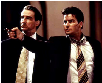
1997 HAUTE TRAHISON (Shadow Conspiracy) de George Pan Cosmatos avec Charlie Sheen