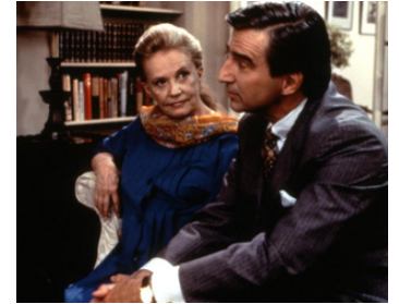
1996 LA PROPRIÉTAIRE (The Proprietor) d'Ismail Merchant avec Jeanne Moreau