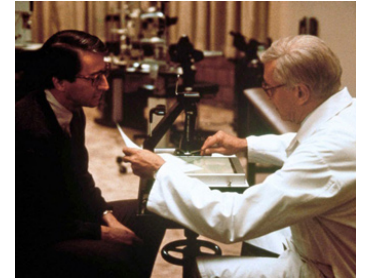
1989 CRIMES ET DÉLITS (Crimes and Misdemeanors) de Woody Allen avec Martin Landau