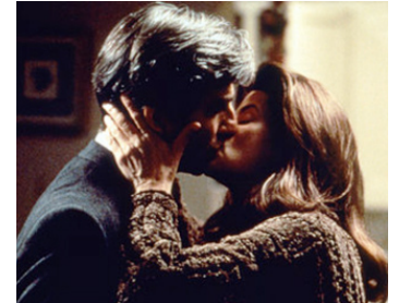
1994 DAVID À LA FOLIE (David's Mother) de Robert Allan Ackerman avec Kristie Alley