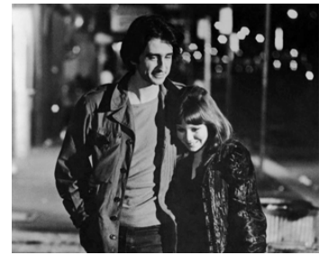
1971 WHO KILLED MARY, WHAT'S 'ER NAME? d'Ernest Pintoff avec Alice Playten