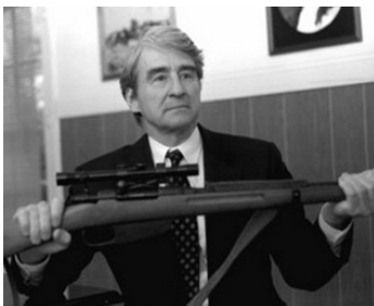
2003 LA COMMISSION (The Commission) de Mark Sobel