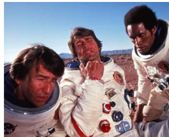
1978 CAPRICORN ONE (Capricorn One) de Peter Hyams avec James Brolin, O. J. Simpson