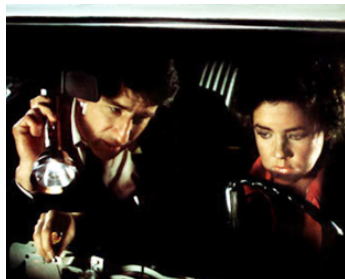
1976 VOL À LA TIRE (Sweet Revenge) de Jerry Schatzberg avec Stockard Channing