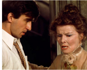
1973 LA MÉNAGERIE DE VERRE (The Glass Menagerie) d'A. Harvey avec Katharine Hepburn