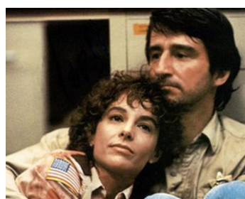
1985 CONTACT MORTEL (Warning Sign) d'Hal Barwood avec Kathleen Quinlan