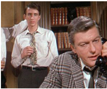
1967 UN SI GENTIL PETIT GANG (Fitzwilly) de Delbert Mann avec Dick Van Dyke