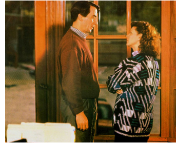
1989 WELCOME HOME (Welcome Home) de Franklin J. Schaffner avec JoBeth Williams