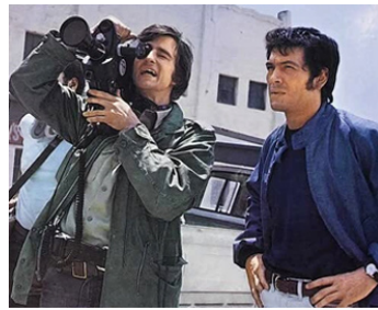
1970 COVER ME BABE de Noel Black avec Robert Forster