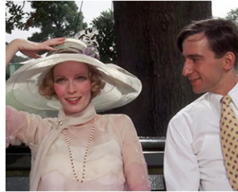
1974 GATSBY LE MAGNIFIQUE (The great Gatsby) de Jack Clayton avec Mia Farrow