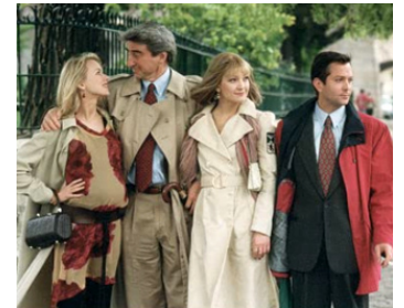
2003 LE DIVORCE de James Ivory avec Naomi Watts, Kate Hudson, Thomas Lennon