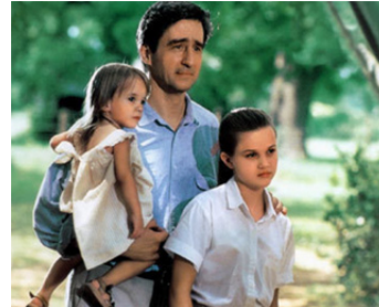
1991 UN ÉTÉ EN LOUISIANE (The Man in the Moon) de Robert Mulligan avec Reese Witherspoon