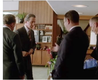
1995 NIXON (Nixon) d'Oliver Stone avec Anthony Hopkins, James Woods