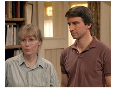
1987 SEPTEMBER (September) de Woody Allen avec Mia Farrow