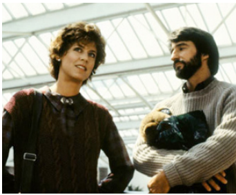
1986 ÇA RESTERA ENTRE NOUS (Just between Friends) d'Allan Burns avec Christine Lahti