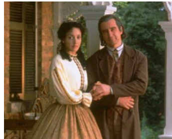
2000 A HOUSE DIVIDED de John Kent Harrison avec Jennifer Beals