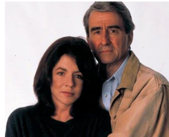
2002 THE MATTHEW SHEPARD'S STORY de Roger Spottiswoode avec Stockard Channing