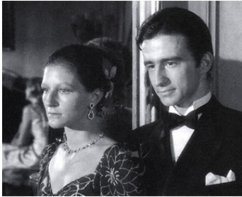
1972 SAUVAGES (Savages) de James Ivory avec Susan Blakely