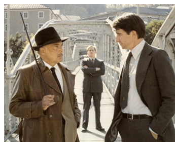
1980 JEUX D'ESPIONS (Hopsotch) de Ronald Neame avec Herbert Lom