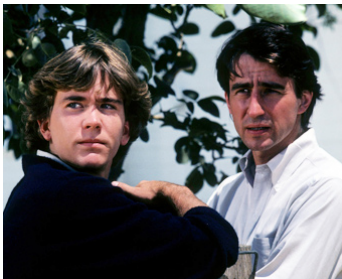
1979 MORT AU COMBAT (Friendly Fire) de David Greene avec Timothy Hutton