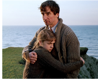
1989 LA RÉCONCILIATION (Lantern Hill) de Kevin Sullivan avec Marion Bennett