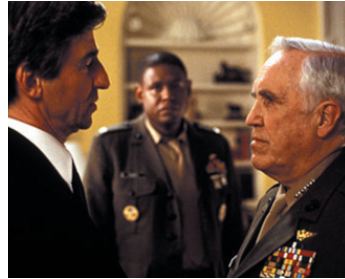
1994 L'ENNEMI EST PARMIS NOUS (The Enemy within) de J. Darby avec F. Whitaker, J. Robards