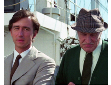
1975 LE VOYAGE DE LA PEUR (Journey into Fear) de Daniel Mann avec Vincent Price