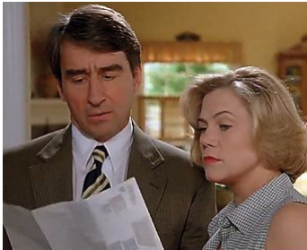
1994 SERIAL MOTHER (Serial Mom) de John Walters avec Kathleen Turner