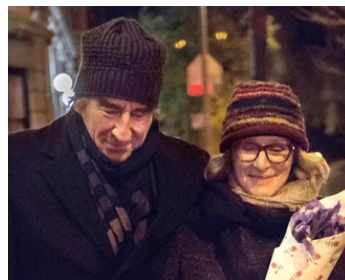
2015 ANESTHÉSIA (Anesthesia) de Tim Blake Nelson avec Glenn Close