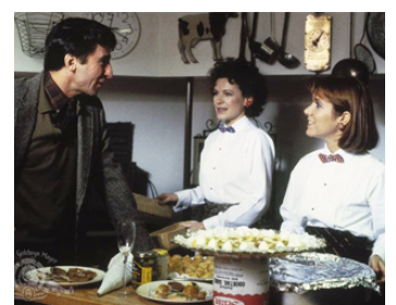
1986 HANNAH ET SES SŒURS (Hannah and her Sisters) de W. Allen avec D. Wiest, C. Fischer