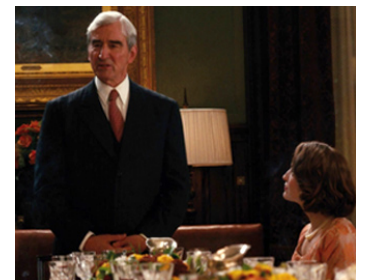
2018 UNE FEMME D'EXCEPTION (On the Basis of Sex) de Mimi Leder avec Felicity Jones