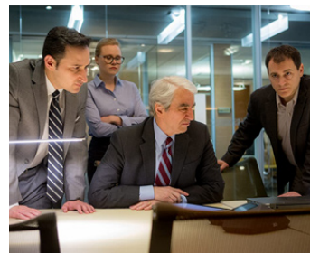
2016 MISS SLOANE (Miss Sloane) de John Madden avec Raoul Bhaneja, Alison Pill, Michael Stuhlb