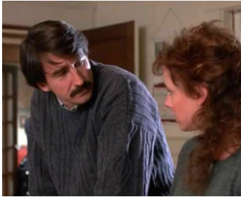
1987 LA CHAMBRE DU HAUT (The Room upstairs) de Stuart Margolin avec S. Channing