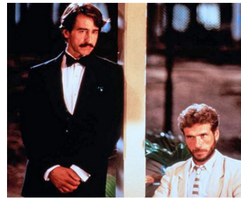
1987 DES TEUFELS PARADIES de Vadim Glowna avec Jürgen Prochnow