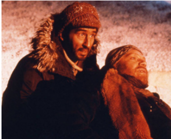
1990 UN PRISONNIER DE LA TERRE (A Captive in the Land) de John Berry avec A. Potapov